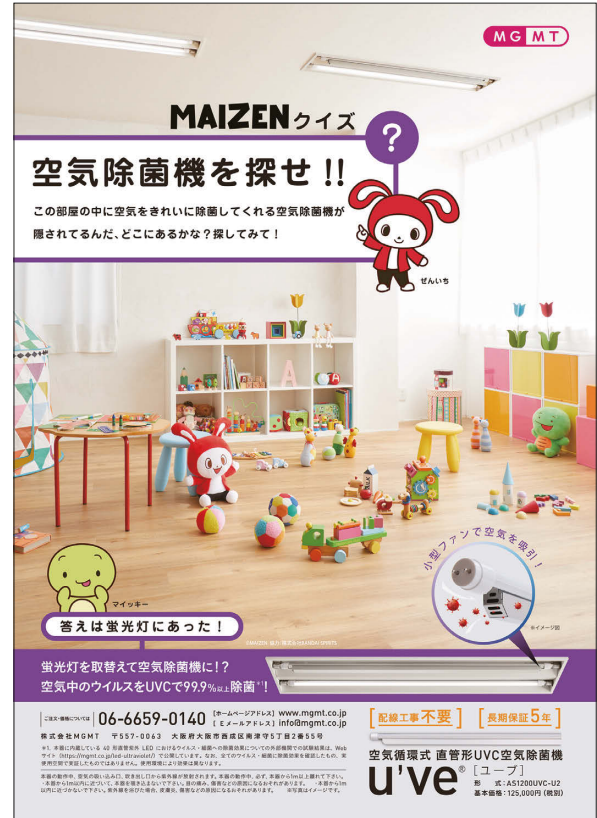
雑誌広告のイメージ