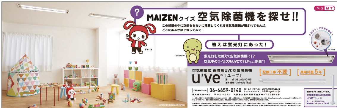
交通広告イメージ

株式会社MGMT(本社:大阪市西成区南津守、代表取締役:上田 益夫)は、波長275nmのUVC領域の紫外線により、空間内のウイルスまたは細菌を99.9%以上除菌*1する40形直管紫外LEDを搭載した、40形の蛍光灯器具に取付けられる空気循環式の直管形UVC空気除菌機「u've®(ユーブ)」AS1200UVCシリーズを2023年1月に発売し、法人向けに販売を開始しましたのでお知らせします。