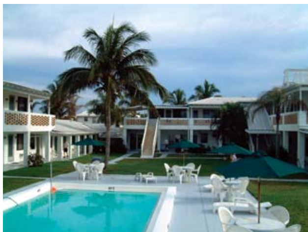
モーター「トロピカル・アイル」の中庭

翌日は、何はともあれ、昔仕事をしていたRCAの工場があったところへ行ってみました。RCAは1970年代にそこから撤退したので、もう跡形もないかも知れないと思っていました。車で近づくと、その付近の道路は大幅